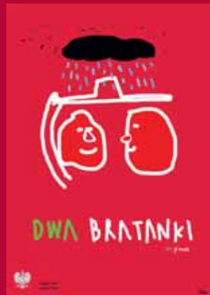
Lakos Tamás munkája