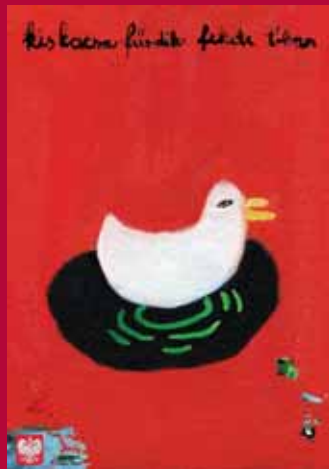
Nagy Zita munkája