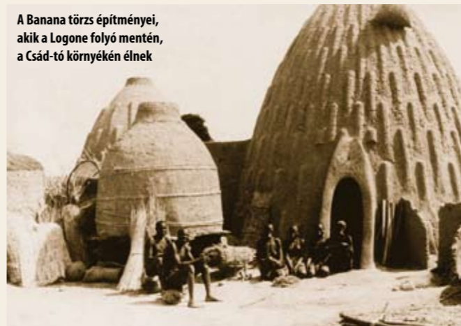
A Banana törzs építményei, akik a Logone folyó mentén, a Csád-tó környékén élnek