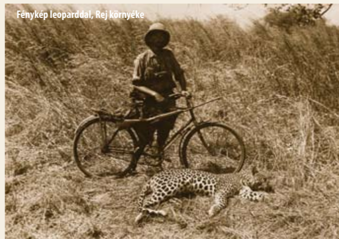
Fénykép leopárdal, Rej környéke